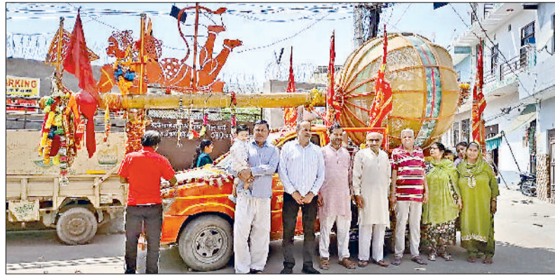
झज्जर। लेखराज मंदिर के नजदीक पहुंची शोभायात्रा के दौरान एकत्रित श्रद्धालु।

कंचन सेवा संस्थान उदयपुर में बनाए रहे ऐतिहासिक मंदिर में 11 मुखी और 84 फीट के ऊंचे हनुमान जी की प्रतिमा का निर्माण किया जा रहा है। इसी के चलते अष्टधातु से निर्मित 21 फीट लंबी हनुमान जी की पवित्र गदा बोते करीब 29 माह से भारत भ्रमण कर रही है। मंगलवार को पवित्र गदा की शोभायात्रा शहर के मुख्य चौक-चौराहों से गुजरी। सुबह बादली रोड स्थित शिवालय मंदिर से शुरू हुई शोभायात्रा शहर के प्रमुख मंदिरों में पहुंची। इस दौरान कंचन-बीच में श्रद्धालुओं द्वारा गाड़ी पर विराजमान हनुमान जी की 21 फीट लंबी गदा के दर्शन किए तथा गाड़ी को रोक कर वीर बजरंगी पूजा अर्चना की। जब यात्रा शहर के मंदिरों में पहुंची तो वीरशाल गदा को देखने के लिए श्रद्धालुओं का तांता लगा रहा। इस दौरान लोगों ने गदा पर मन्त्र के धागे भी बांधे। दिनभर में यह शोभायात्रा 84 घंटों वाले