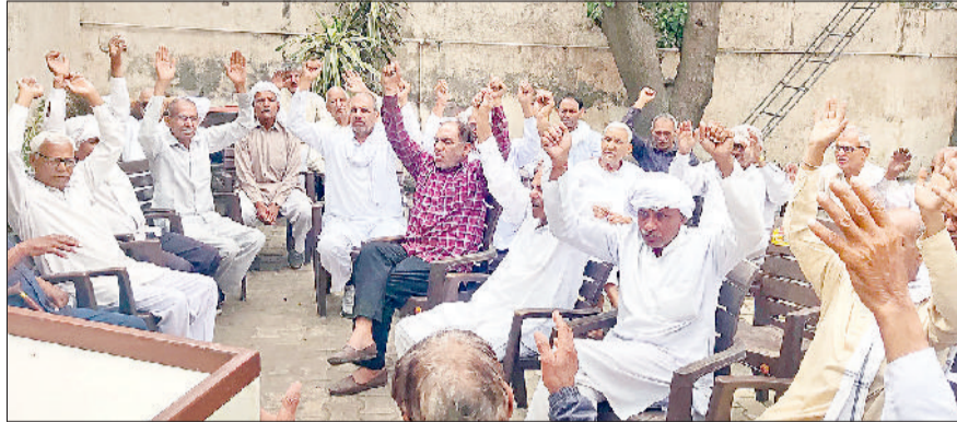
बहादुरगढ़। बैठक में नारेबाजी करते रिटायर्ड कर्मचारी वेलफेयर एसोसिएशन के सदस्य।

रिटायर्ड कर्मचारी वेलफेयर एसोसिएशन की ब्लॉक स्तरीय बैठक में सेवानिवृत्त कर्मचारियों की मांगों को लेकर विचार-विमर्श किया गया। बैठक में मांगों को लेकर सरकार के खिलाफ नारेबाजी भी की गई तथा साथ ही चेतावनी दी गई कि अगर सरकार ने उनकी मांगों को जल्द ही पूरा