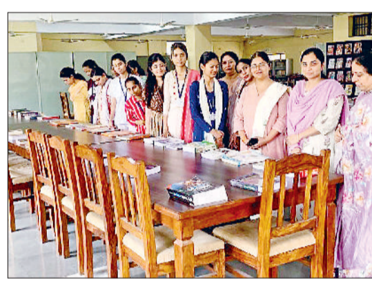
बहादुरगढ़। पुस्तक प्रदर्शनी का अवलोकन करती प्रिंसिपल व छात्राएं।

राजकीय महिला महाविद्यालय के पुस्तकालय में मंगलवार को एक भव्य एवं ज्ञानवर्धक पुस्तक प्रदर्शनी का आयोजन किया गया। इस प्रदर्शनी के दौरान छात्राओं से पठन-पाठन की रुचि विकसित करने, शैक्षणिक जागरूकता बढ़ाने तथा ज्ञान के प्रति सकारात्मक दृष्टिकोण अपनाने का आह्वान किया गया। प्रदर्शनी में शैक्षणिक पाठ्यपुस्तकों, प्रतियोगी परीक्षाओं की तैयारी के लिए पुस्तकों,