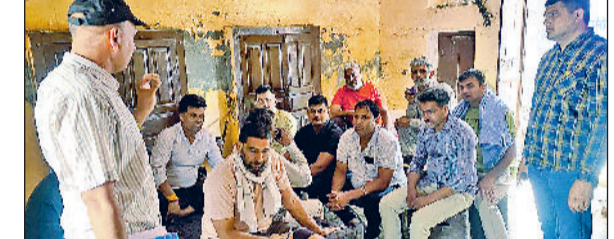
झज्जर। ग्रामीणों को जागरूक करते हुए पुलिस टीम।

मंगलवार को क्षेत्र के गांव विसाहन और गोच्छी में पुलिस टीम द्वारा ग्रामीणों को नशे के दुष्प्रभाव, डायल 112 व साइबर फ्रॉड के प्रति जागरूक किया। एसआई पवन कुमार ने बताया कि नशा न केवल व्यक्ति के शारीरिक और मानसिक स्वास्थ्य को नुकसान पहुंचाता है, बल्कि परिवार की आर्थिक स्थिति और सामाजिक माहौल को भी