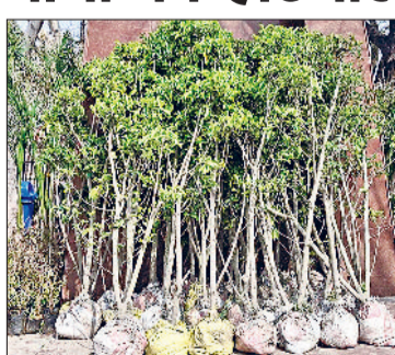
झंझर। नगर परिषद द्वारा पार्क में रोपित करने के लिए रखे गए पौधे।