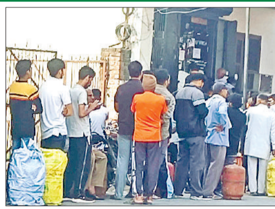
बहादुरगढ़। एजेंसी के बाहर लगी लोगों की लाइन।

बहादुरगढ़। कमर्शियल सिलेंडर की सप्लाई फिलहाल बंद है और लोगों में घरेलू सिलेंडर को लेकर भी चिंता बनी हुई है। ऑनलाइन बुकिंग में परेशानी हो रही है। इसी वजह से बहादुरगढ़ की तमाम गैस एजेंसियों पर सुबह होते ही लाइन लग जाती है। मंगलवार की सुबह भी यहाँ झज्जर रोड स्थित राम गैस एजेंसी, परशुराम मार्ग स्थित भारत गैस व शहर में मौजूद अन्य एजेंसियों पर लोग सिलेंडर लेकर कतार में खड़े थे। बेशक लाइन लगी थी लेकिन दोपहर तक लोगों को सिलेंडर मिल रहे थे। किसी तरह की मारामारी की स्थिति फिलहाल नहीं है। हां, होटल-ढाबा संचालकों और खाद्य पदार्थ बेचने वाले रेहड़ी संचालकों के सामने जरूर मुश्किलें खड़ी हुई हैं। वहीं, खाद्य आपूर्ति विभाग की ओर से लगातार एजेंसियों पर निगरानी की जा रही है। कालाबाजारी व जमाखोरी को आशंकाओं को देखते हुए विभाग सतर्क है।