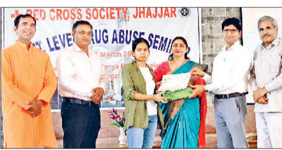
बहादुरगढ़। विजेता छात्रा को पुरस्कृत करते एडीसी व प्रिंसिपल आदि।